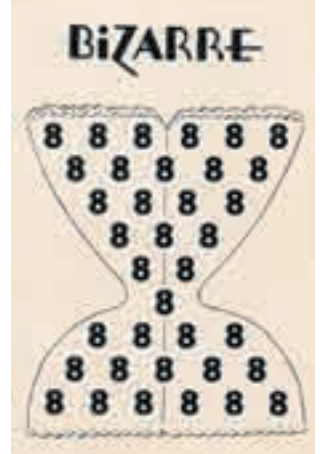
Bizarre , n° 8, 1952

Petit à petit aux USA, d'émissions télévisées en interviews à la radio, de fêtes en défilés de mode grande taille, le cercle s'élargit et recrute des adhérents dans un nombre croissant d'états américains. S'inscrivant d'emblée dans la logique communautariste typique de l' American Way Of Life le mouvement se développe peu à peu : les gros et leurs compagnons et compagnes développent l'idée d'une communauté qui doit défendre ses droits et se doter de ses propres instruments (presse, lieux divers, style, restos, boîtes, magasins de fringues, etc.). À l'intérieur de la NAAFA, des sous-groupes thématiques se forment peu à peu : adolescents, gays et lesbiennes, diabétiques, gens de plus de 250 kilos, etc. Un premier journal underground baptisé Dimension voit le jour... Immédiatement le mouvement est soutenu par nombre de féministes traditionnelles d'outre-Atlantique, qui ont toujours vu dans le cliché de la poupée Barbie le symbole du patriarcat et du sexisme.